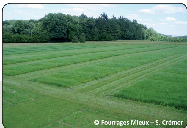
▼ Figure 1. Vue d'une parcelle de variétés de ray-grass anglais testées en régime de fauche

Les listes des pages 2 et 3 ne sont pas exhaustives car toutes les variétés disponibles dans le commerce n'ont pas été testées dans nos essais. Sont reprises dans les tableaux 1 et 2 les variétés qui se sont révélées les meilleures dans les essais et qui sont commercialisées en 2017.